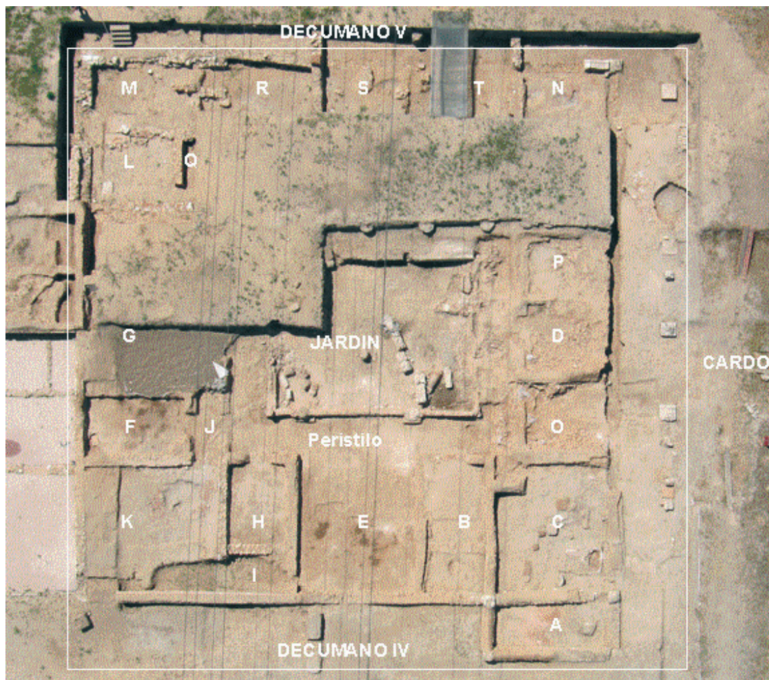
Lámina 1. Vista aérea de la Casa de los Grifos en proceso de excavación y con denominación de estancias.

Sus dimensiones son 30 m (eje E-W) x 30 m (eje N-S) , 900 m 2 de superficie, a la que hay que añadir una estancia adosada en su esquina Noroeste de 7,50 m x 3,60 m. Adaptada al tamaño de las manzanas en el barrio SW de la ciudad.