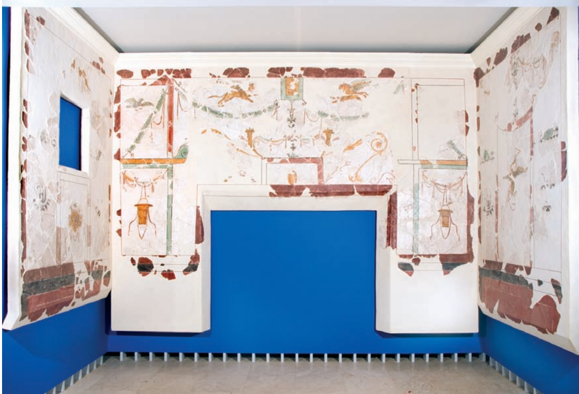
Lámina 2. Pintura mural restaurada, muros de la estancia "J" de la Casa de los Grifos.

Según la función de la estancia, la decoración puede ser más o menos profusa. Contamos con estancias con paneles con fondos blancos y a lo sumo con finas líneas de encuadramiento o sencillas bandas de separación o con salpicones de color rojo y sin más artificio, frente a estancias decoradas con más complejidad donde se han documentado alternancia de grandes paneles monocromos de vivos colores: rojos separados por interpaneles, o combinados de rojos, blancos y negros separados por bandas, o combinaciones de paneles negros y amarillos, enmarcados y decorados siempre por filetes o bandas decorativas, separados por interpaneles mas estrechos con diferentes repertorios ornamentales como candelabros vegetales o columnas pintadas.